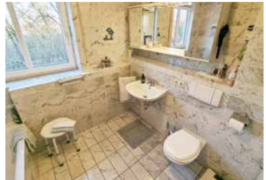
Badezimmer mit Badewanne, Dusche und WC