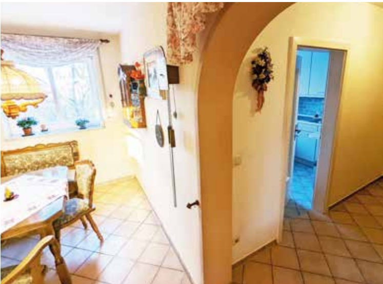
Esszimmer mit Blick auf Eingang und Küche