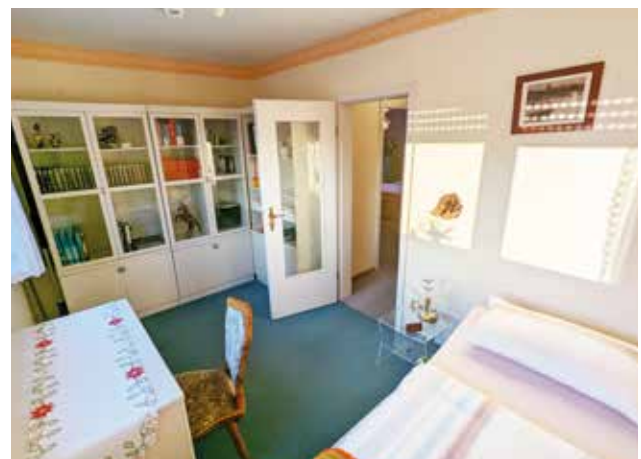
Gästezimmer / Arbeitszimmer / Kinderzimmer