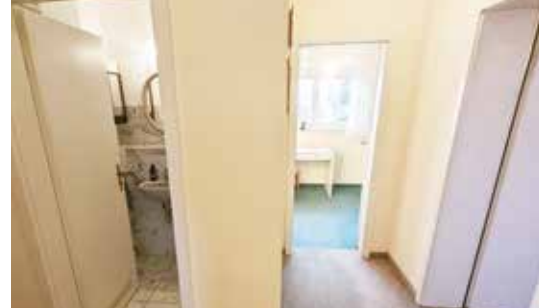
Flur mit Blick auf Gästezimmer und WC