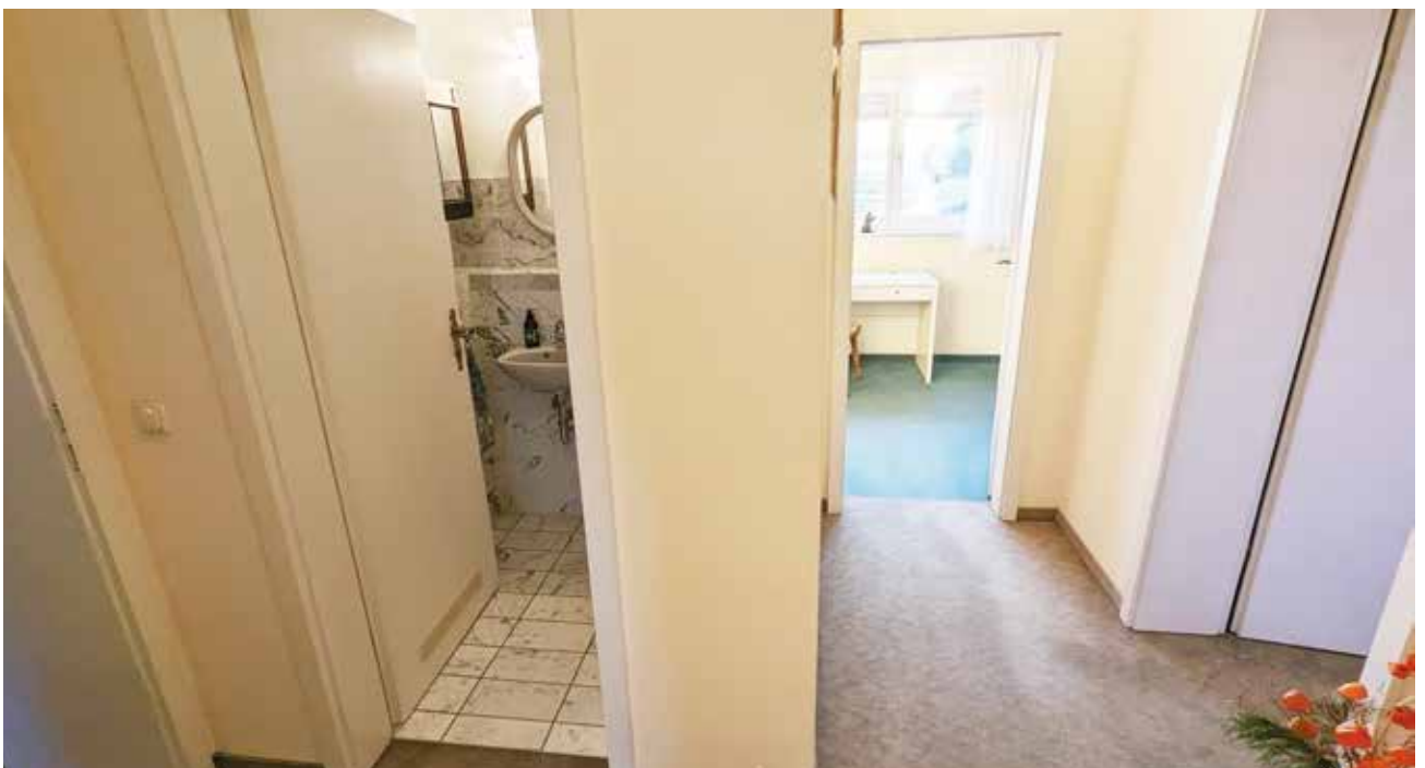
Flur mit Blick auf Gäste-WC und zweites Zimmer