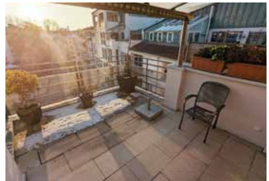
Großer Balkon mit Abstellkammer außen